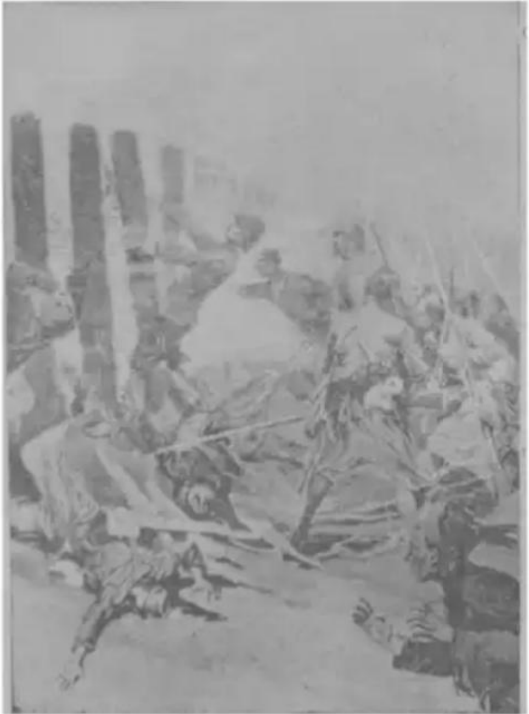
القوات الفرنسية تنساق ذليلة أمام أسوار كونو